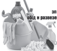
График 5/2, зп 350 в день, обід и развезення додому НАДАЄМО